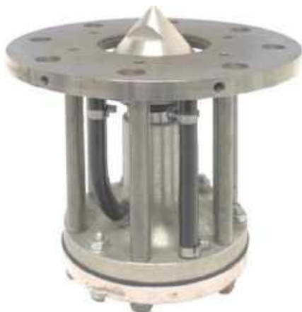
Soupape de transfert