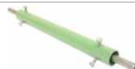
Tube plongeur distributeur d'abrasif