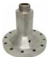
Corps de soupape