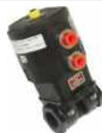
Vanne de dpressurisation