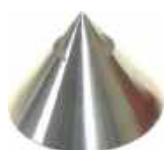
Cône alu de soupape