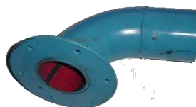
Coude entrde cyclone garni linatex