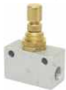
Limiteur de débit