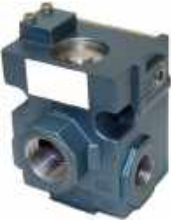
Vanne 3 voies 1/2 '' Vanne 3 voies 3/4''