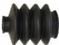
Soufflet de soupape