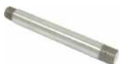
Axe de soupape