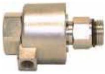
Vanne de pilotage 2 voies