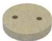
Pierre de fluidisation 2 trous