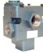
Vanne 3 voies 3/4'' Vanne 3 voies 1''3/4