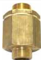
Clapet anti retour 1" 1/4