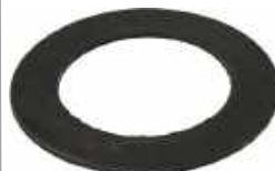
Joint embase de fluidisation