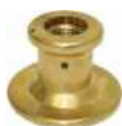
Embase axe de soupape