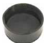
Bouchon de distributeur ALV92