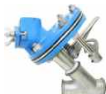
Distributeur d'abrasif à plateau