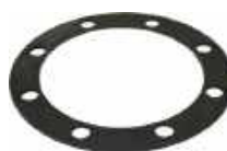
Joint infrieur de soupape