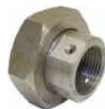
Accord de tuyau de sablage