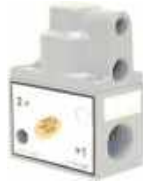
Vanne de pilotage 2 voies