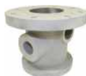
Corps de vanne d'alimentation d'abrasif