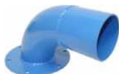
Coude entrde cyclone