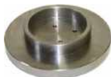
Embase de fluidisation