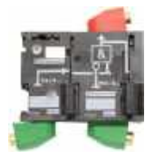
Cellule cycle continu