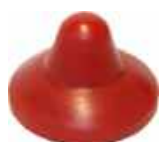
Cône PU de soupape