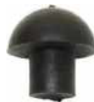
Champignon de verin