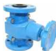
Distributeur d'abrasif à volant