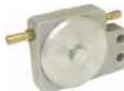
Ref: CAR114vibrateur grand modle