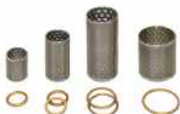
Cartouche et joint pour filtre panier