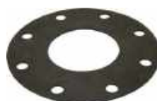
Joint suprieur de soupape